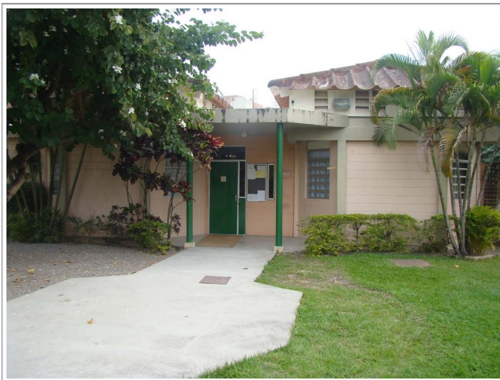
Figura 1 - Creche UFF

Começamos com um lugar: uma unidade federal de Educação Infantil, carinhosamente chamada de Creche UFF, localizada na universidade de mesmo nome.