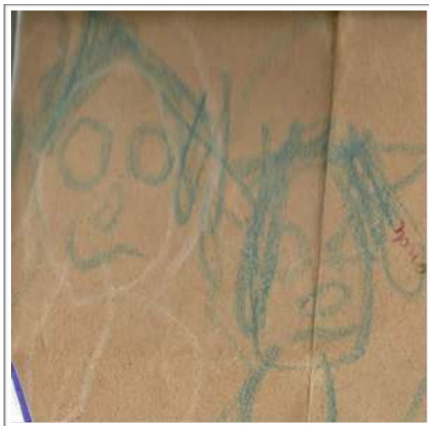
Figura 4 - Os Fantasmas

Tudo isso é algo, a nosso ver, fundamental, pois se nosso olhar adulto, já não consegue ver mais fantasmas circulando pela creche, ou se os desloca para um mundo de fantasia, basta olhar o mapa criado pelas crianças, para lembrarmos da sua existência (e por que não dizer: da nossa?):