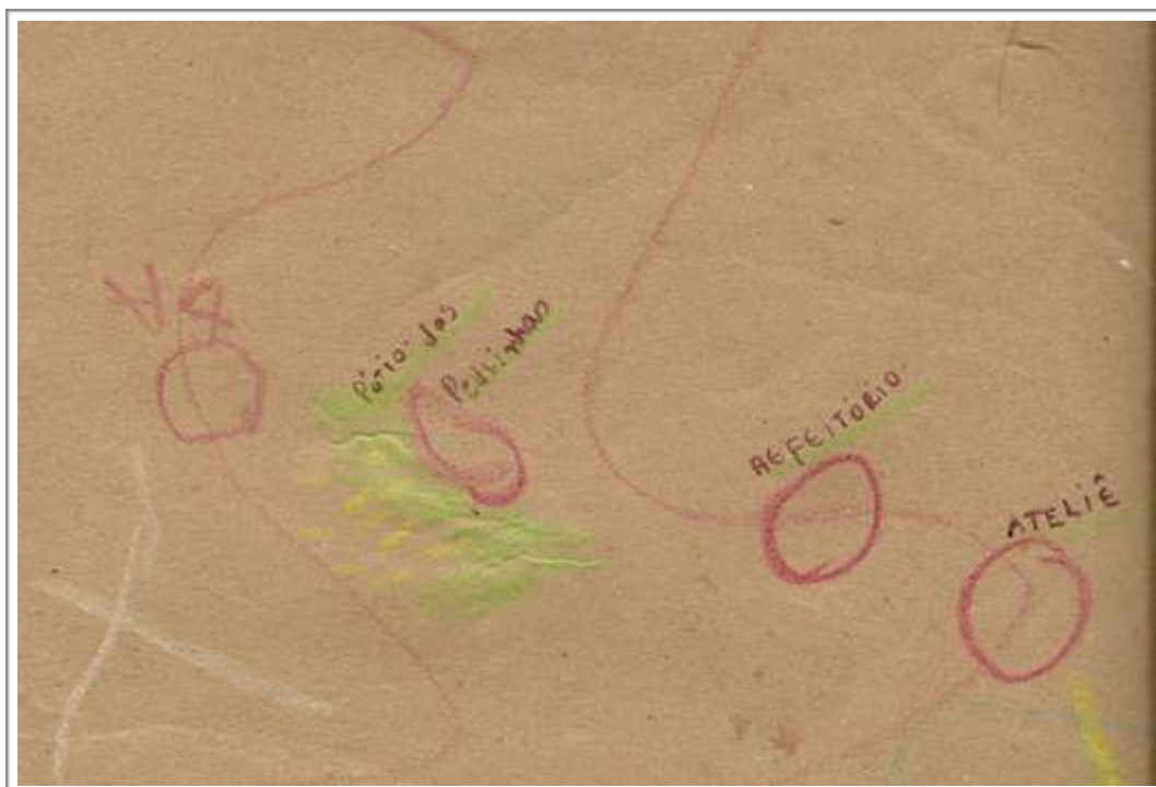
Figura 2 - Pedaco de mapa com o trajeto por onde passaram os fantasmas.