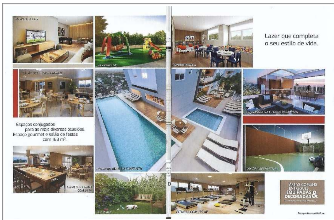
Figura 1: Serviços ofertados em um material de divulgação.

Texto das imagens da figura: Salão de jogos; Playground; Salão de festas com 84m 2 ; Espaço gourmet com 84m 2 ; Piscinas adulto e infantil; Pet place; Brinquedoteca; Fitness com 139m 2 ; Churrasqueira e forno para pizza; Quadra recreativa. Org.: Elaboração própria (2020).