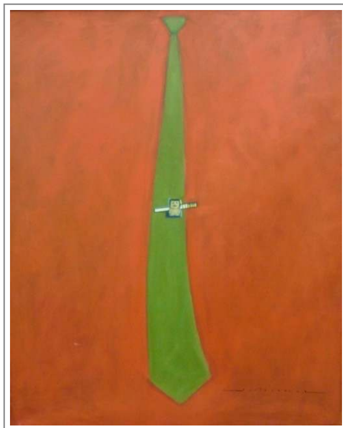
Figura 4: Dos Bugres (1999) - Óleo sobre tela 100 X 80 cm.

A obra possui elementos que proporcionam potencial para diversas imaginações espaciais, mas o que mais se expressou durante a experimentação foi o desgosto pelos mandatários de latifúndios, uma imaginação que movimentou o pensamento dos estudantes.