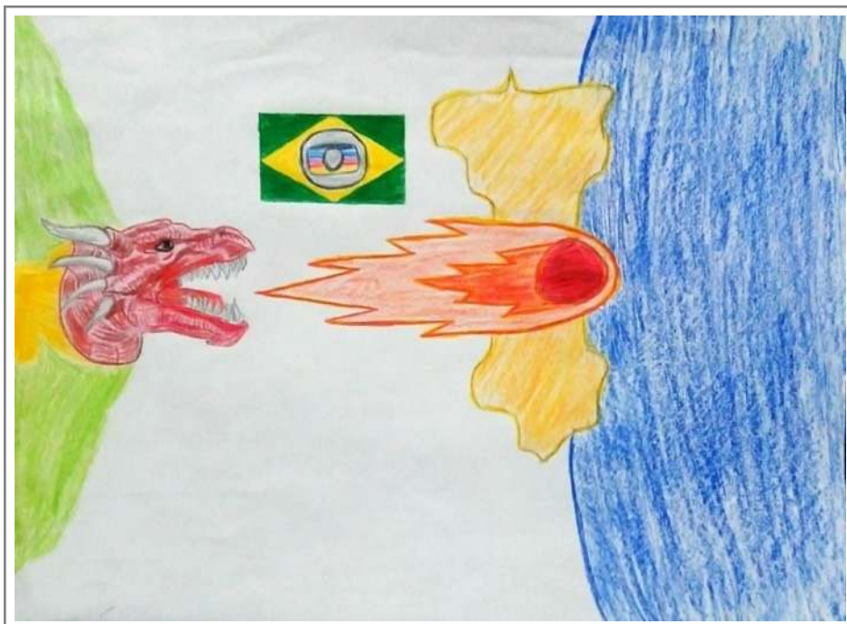
Figura 2: Releitura 1 da obra “O Sopro”, criada por estudante do Ensino Fundamental (2018).