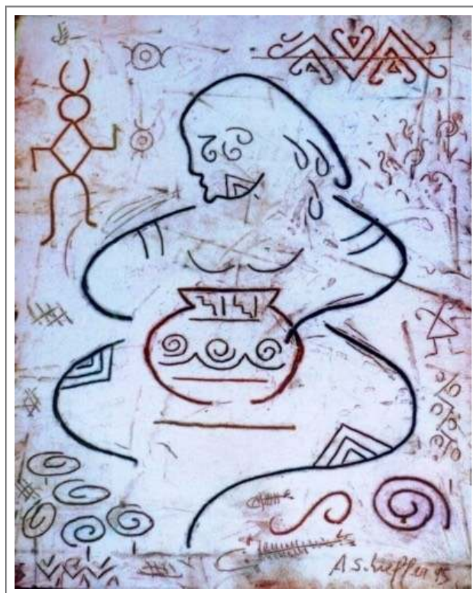
Figura 7: A ceramista (1995) - Técnica mista sobre tela 46X54 cm.

O encontro entre Arte e Geografia provocou os estudantes a imaginarem trajetórias sufocadas no decorrer da história do Mato Grosso do Sul, que é associada à produção agropecuária, pela mídia e pelas imagens oficiais dos lugares. O pensamento foi provocado a superar a narrativa dominante, gerando a possibilidade de se imaginar o espaço pela sua principal característica, a multiplicidade (MASSEY, 2008). Já a obra a seguir, traz traços inspirados em populações indígenas, ampliando o pensamento acerca do espaço. “A ceramista” criada pelo artista Adilson Schieffer, no ano de 1995, foi produzida com a técnica mista sobre tela, expressando uma característica do artista na elaboração de artes plásticas utilizando a iconografia indígena. Observe através da cerâmica, as cores, os traços, o estilo inspirado na cultura dos povos originários.