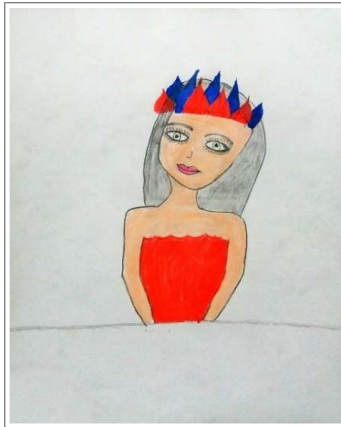
Figura 8: Releitura da obra “A Ceramista” 1, criada por estudante do Ensino Fundamental (2018).

Na figura, a mulher segura em suas mãos uma cerâmica, tradição dos grupos dessa etnia. O artista possui uma série de pinturas ligadas às mulheres indígenas personificadas como santas, ceramistas, caçadoras, buscando expressar a força das mulheres no seu cotidiano, com uma técnica em gravuras e em cimento-relevo. Os elementos presentes na obra provocaram os estudantes a dialogarem sobre a força da mulher resistindo a uma sociedade patriarcal. A seguir nas Figuras 8 e 9, criações de estudantes inspirados em “A Ceramista”.