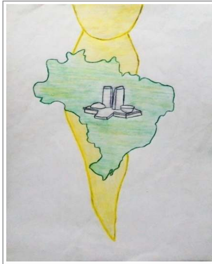
Figura 6: Releitura da obra “Dos Bugres” 2, criada por estudante do Ensino Fundamental (2018).

Nesta imagem (Figura 6) noto uma referência ao Palácio do Planalto ao centro de um mapa do Brasil. No diálogo com a estudante, a criadora do desenho externou que “o índio não pode estar servindo de enfeite na gravata, quem usa gravata é quem tem poder, e está morando aqui nesse palácio” (informação verbal) 6 . A fala da estudante sobre sua releitura demonstra reflexões acerca da posição imposta à população indígena. A substituição do broche, em sua releitura, conectada com sua explanação, demonstra uma preocupação em retirar a imagem indígena dessa condição e coloca como objeto o símbolo da política brasileira.