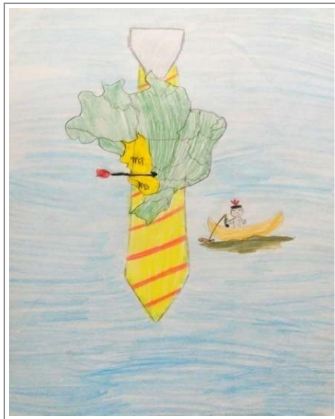
Figura 5: Releitura da obra “Dos Bugres” 1, criada por estudante do Ensino Fundamental (2018).

A estudante que criou a imagem da Figura 5 sugeriu de retirar o indígena da condição de dominado. Um desenho com referência ao mapa do Brasil ocupa a posição de objeto na gravata. A figura indígena é desenhada pela estudante em um barco, não vinculado aos outros elementos centrais do desenho, pescando em um fundo azul que se refere à água. A estudante explicou que “agora o índio está livre para pescar, antes ele estava preso no meio de quem usa gravata e destrói a natureza” (informação verbal) 5 .