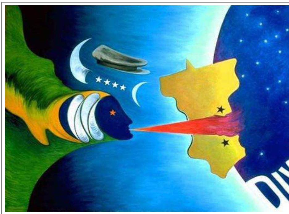
Figura 1: O Sopro (1978) - Óleo sobre tela 130 X 170 cm.

procurando retratar qual era o modo de viver que monopoliza a narrativa sul-mato-grossense.